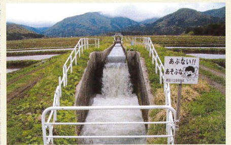
第2号導水幹線路(仁田山)