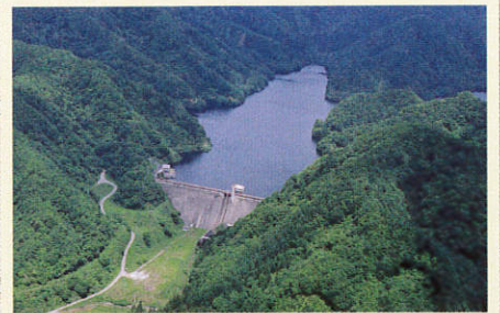
樹沢ダム(金山町下野明)