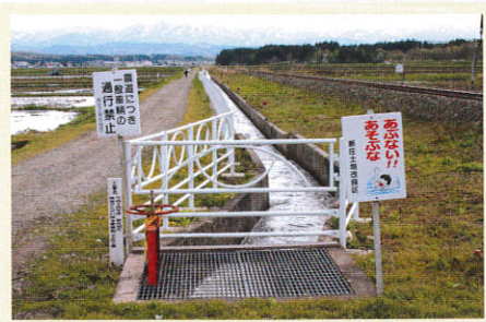
沼田水路(下西山踏切付近)